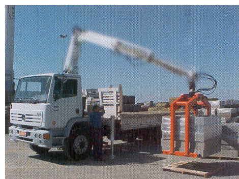
Ouverture maximum pour une hauteur de prise réduite

Pression de Service : 200 à 320 bar / Débit : 25 à 75 L/mn